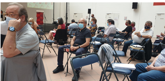
Dans le respect des gestes barrières

Les travaux du comité général se sont terminés avec un appel à engager résolument l'action ainsi que la campagne de renforcement du syndicalisme spécifique et d'abonnement à son journal Vie Nouvelle.